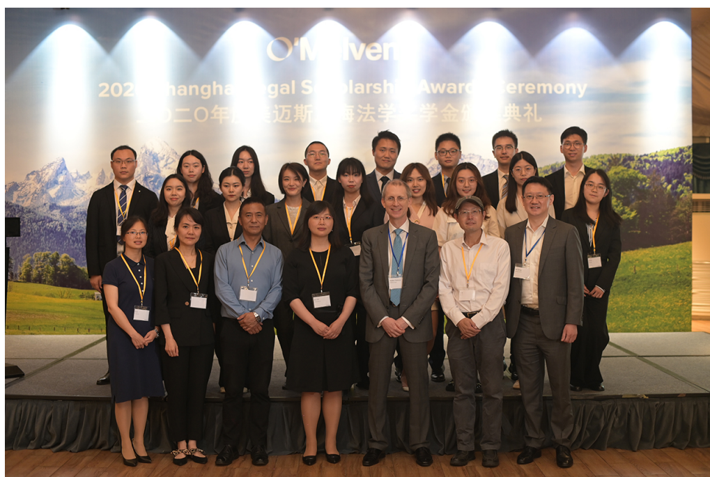
2021 年 6 月，第 23 届美迈斯上海地区法学奖学金颁奖典礼在上海隆重举行。

1998 年，美迈斯律师事务所设立“美迈斯上海地区法学奖学金”，旨在鼓励和资助中国法律专业学生致力于法学学习和研究，协助中国培养优秀法律人才，并增进美中两国法学界的交流与合作。复旦大学法学院、华东政法大学和上海对外经贸大学法学院法律专业学生可以申请该项奖学金。上海交通大学凯原法学院于 2021 年加入该项目。