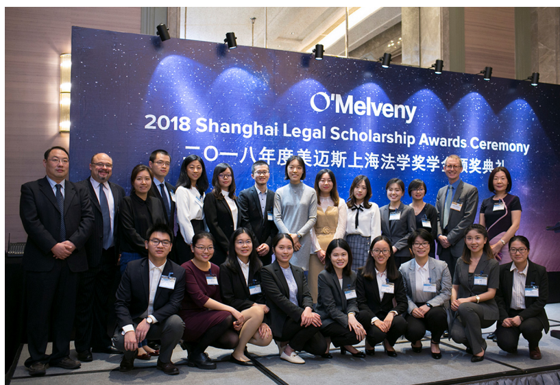
2018 年 10 月，第 21 届美迈斯上海地区法学奖学金颁奖典礼在上海隆重举行。

1998 年，美迈斯律师事务所设立“美迈斯上海地区法学奖学金”，旨在鼓励和资助中国法律专业学生致力于法学学习和研究，协助中国培养优秀法律人才，并增进美中两国法学界的交流与合作。