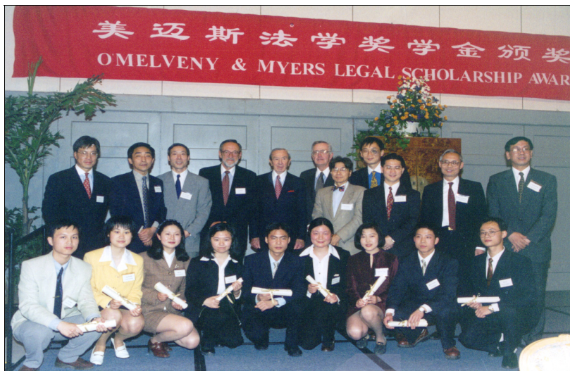
1998年5月，美国前国务卿、美迈斯律师事务所高级合伙人克里斯托弗和美迈斯律师事务所主席、高级合伙人、美迈斯法学奖学金评选委员会全体成员以及第一届美迈斯上海地区法学奖学金获奖者在颁奖典礼上合影留念。

美迈斯律师事务所将向进入面试阶段的学生发出通知，并安排评委会对入围学生进行集中面试。最后，由评委会依面试结果投票确定12名获奖学生（其中包括6名本科生，6名研究生）。在6名本科生获奖学生中确定一等奖3名，二等奖3名（各获奖学生将分别来自于复旦大学法学院、华东政法大学和上海对外经贸大学法学院，其中每个学校一等奖1名，二等奖1名）；在6名研究生获奖学生中确定一等奖3名，二等奖3名（各获奖学生将分别来自于复旦大学法学院、华东政法大学和上海对外经贸大学法学院，其中每个学校一等奖1名，二等奖1名）。如在一等奖的获奖学生中确有特别优秀的，可授予其特等奖。为鼓励获奖学生，美迈斯律师事务所出资奖励一等奖学金获得者每位人民币13,000元，二等奖学金获得者每位人民币7,000元。