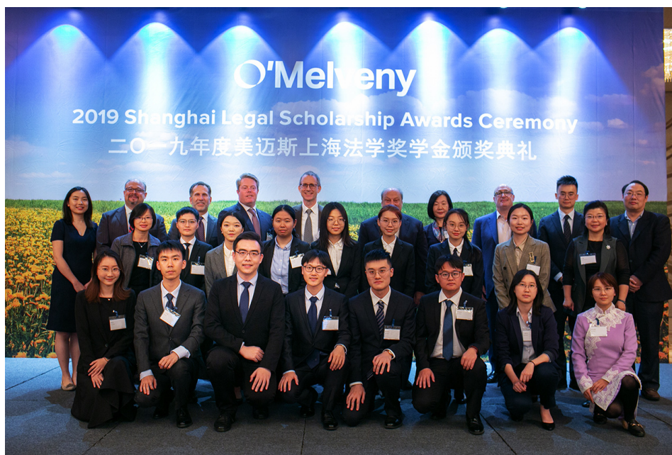
2019 年 11 月，第 22 届美迈斯上海地区法学奖学金颁奖典礼在上海隆重举行。

1998 年，美迈斯律师事务所设立“美迈斯上海地区法学奖学金”，旨在鼓励和资助中国法律专业学生致力于法学学习和研究，协助中国培养优秀法律人才，并增进美中两国法学界的交流与合作。